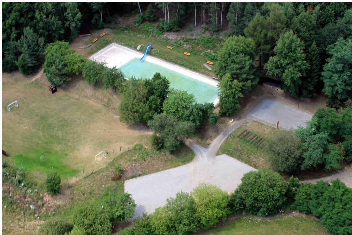
Koupaliště v Borotíně - letecké foto 2014