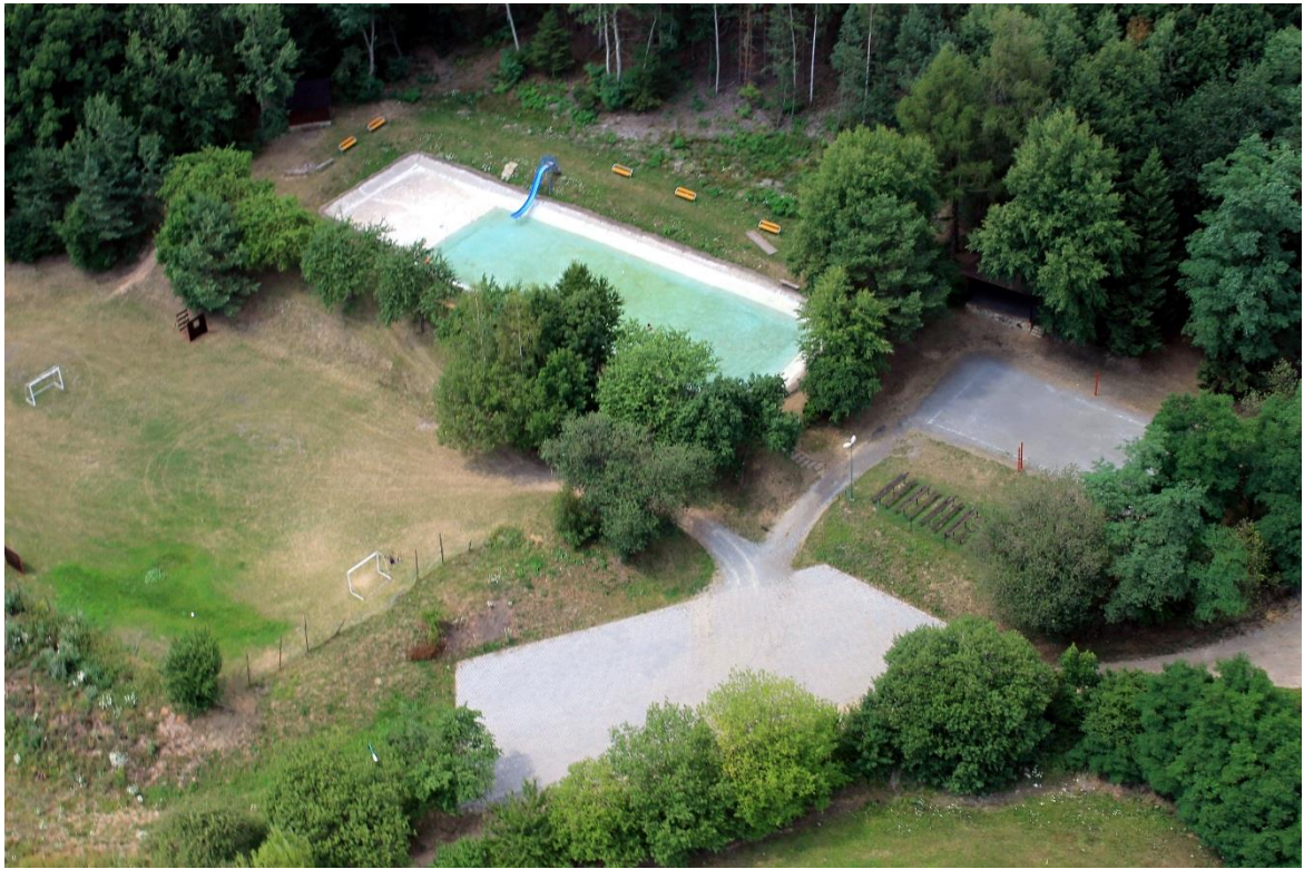
Letecký pohled na sportovní areál Borotín 2014