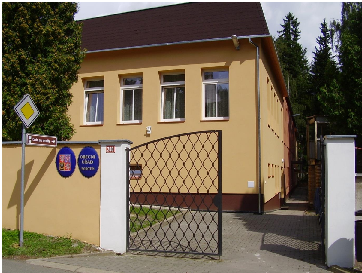
Nově zateplená budova obecního úřadu, pošty a kulturního domu - 2014