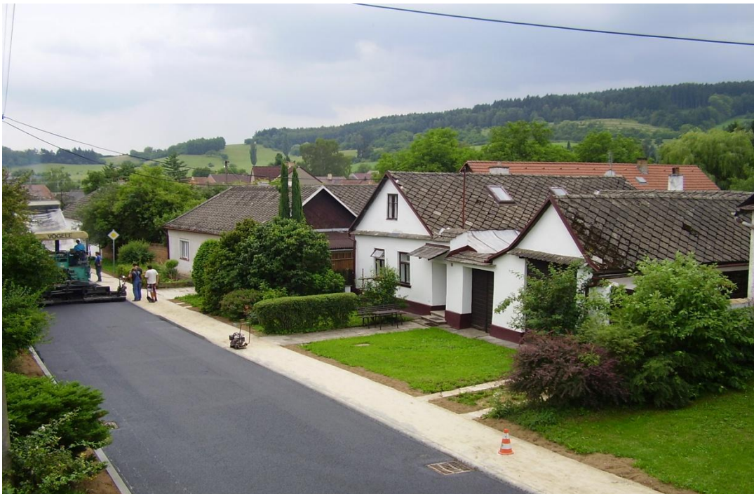
Rekonstrukce místní komunikace v úseku od obchodu - pod koupaliště (2012).