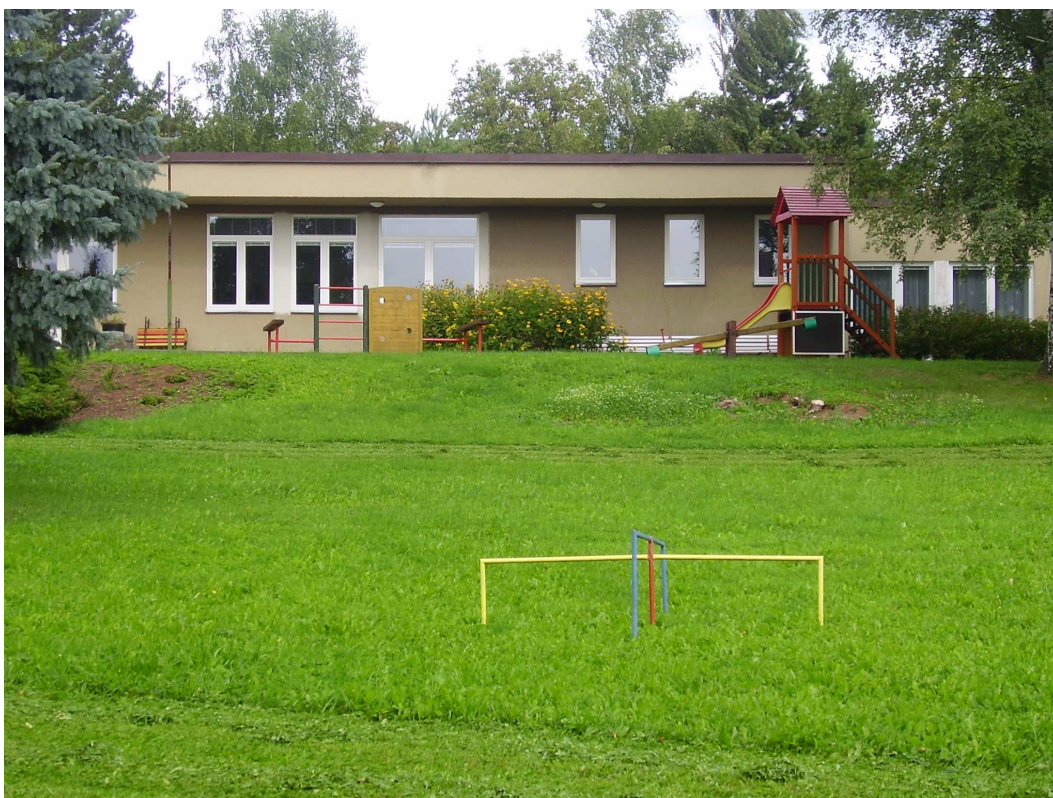
Pohled na Mateřskou školku v Borotíně