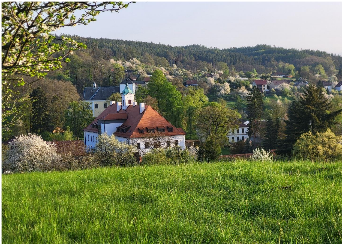
Pohled na jarní Borotín 2025