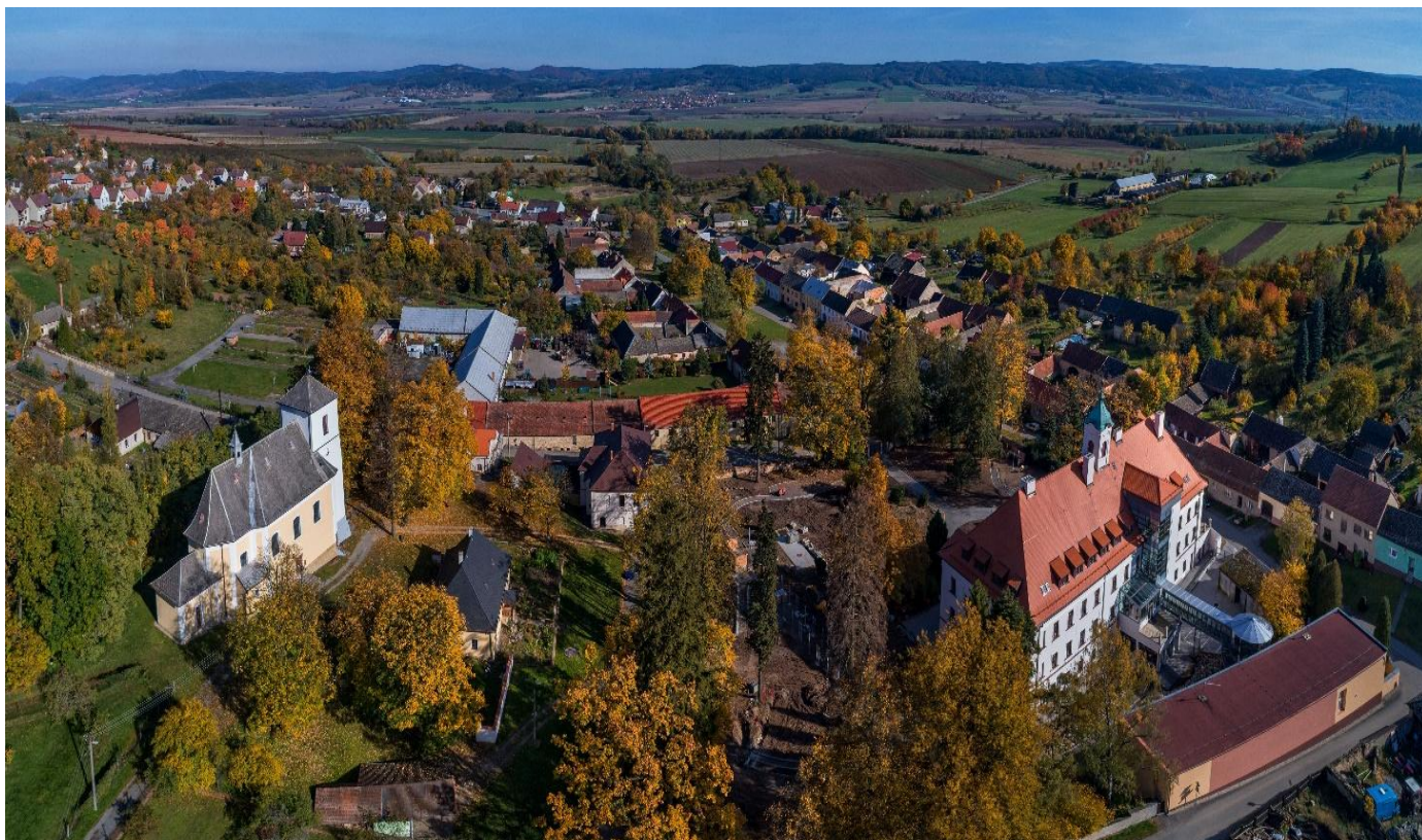
Podzimní pohled na Borotín