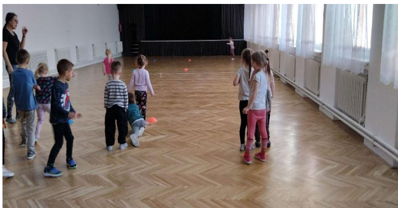
Cvičení v sále kulturního domu