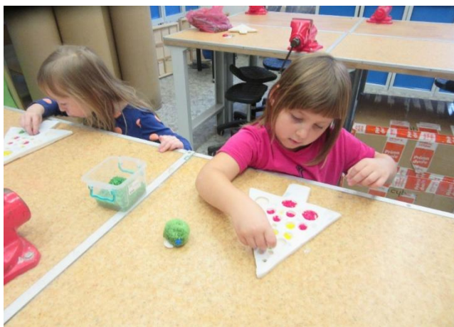
S předškoláky v keramické dílně ZŠ a MŠ Knínice

Mateřská škola Borotín vás srdečně zve ve středu 16. dubna 2025 od 16:00 do kulturního domu na