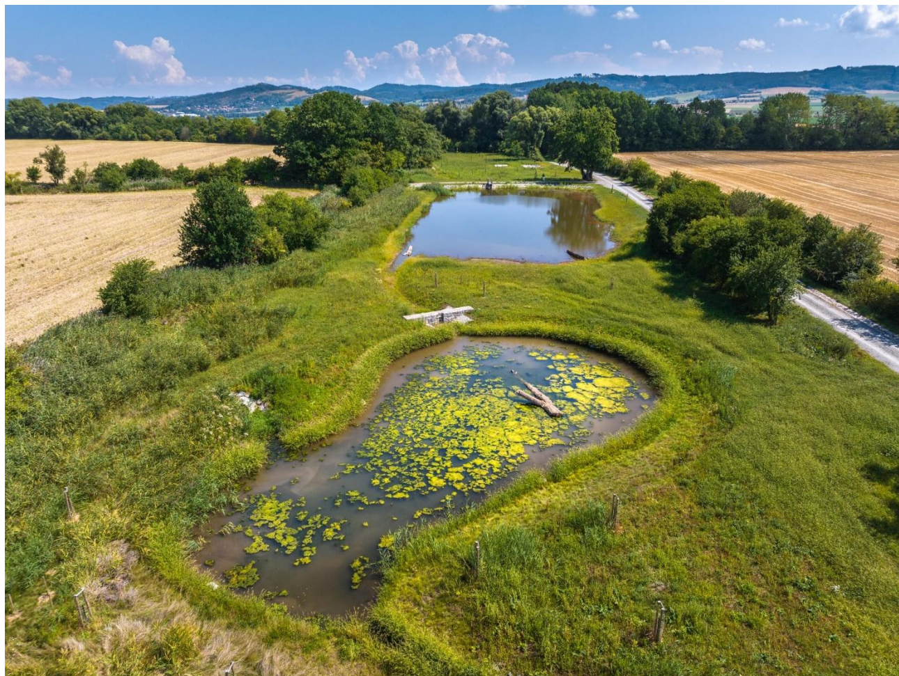
Pohled na biocentrum