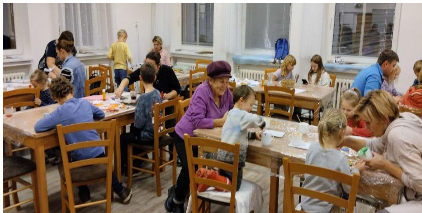
Adventní tvoření prosinec 2024

FOTODOKUMENTACE DĚNÍ V MŠ PROSINEC 2024 - ÚNOR 2025: